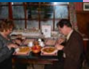
Pannenkoekenhuis De Gelderse Poort

De Theeschenkerij is gelegen op het mooie landgoed Wielbergen. Er is ook een kruiden- en rozentuin, een jeu de boules-baan, een dierenboerderij en een Winkelte waar leuke cadeautjes te koop zijn, gemaakt door mensen met een verstandelijke beperking. Het landhuis Wielbergen kan men in overleg met de medewerkers van de Theeschenkerij