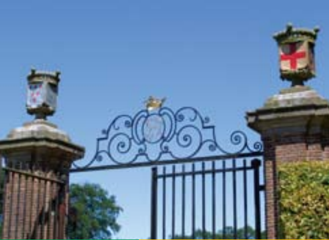
Huis Bingerden Angerlo